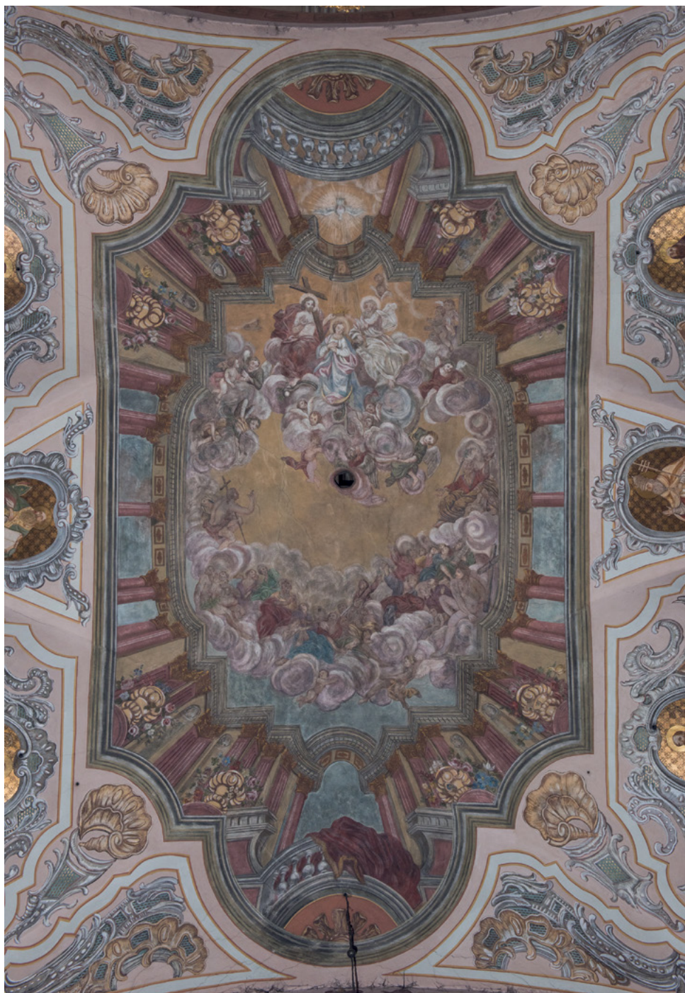
7 Dekoracja malarska sklepienia kościoła Bernardynów w Rzeszowie, ok. 1753–1763.

informację tę podała Janina Dzik ( Euntes in Mundum Universum Praedicate Evangelium , s. 92). Zob. też: ead. „Inspiracje włoskie w XVIII-wiecznej polichromii kościoła OO. Bernardynów w Rzeszowie. Ze studiów nad polskim malarstwem monumentalnym w XVIII wieku”, w: Sanktuarium Matki Bożej Rzeszowskiej 1513–2013 , s. 365–383; Zbigniew Michalczyk, „Książka Janiny Dzik o malarstwie ściennym w Polsce południowo-wschodniej w XVIII wieku”, recenzja Euntes in Mundum Universum Praedicate Evangelium. Programy ideowe osiemnastowiecznych malowideł kościołów zakonnych na ziemiach południowo-wschodniej dawnej Rzeczypospolitej , Janina Dzik, Biuletyn Historii Sztuki 77, nr 1 (2015), s. 153–176; id., „Uwagi o sposobach wykorzystywania architektonicznych i ornamentalnych wzorów graficznych w polskim malarstwie ściennym XVIII wieku”, w: Ornament i dekoracja dzieła sztuki. Studia z historii sztuki , red. Joanna Daranowska-Lukaszewska, Agata Dworzak, Andrzej Betlej (Warszawa: Stowarzyszenie Historyków Sztuki, 2015), s. 263–282; id., W lustrzanym odbiciu .