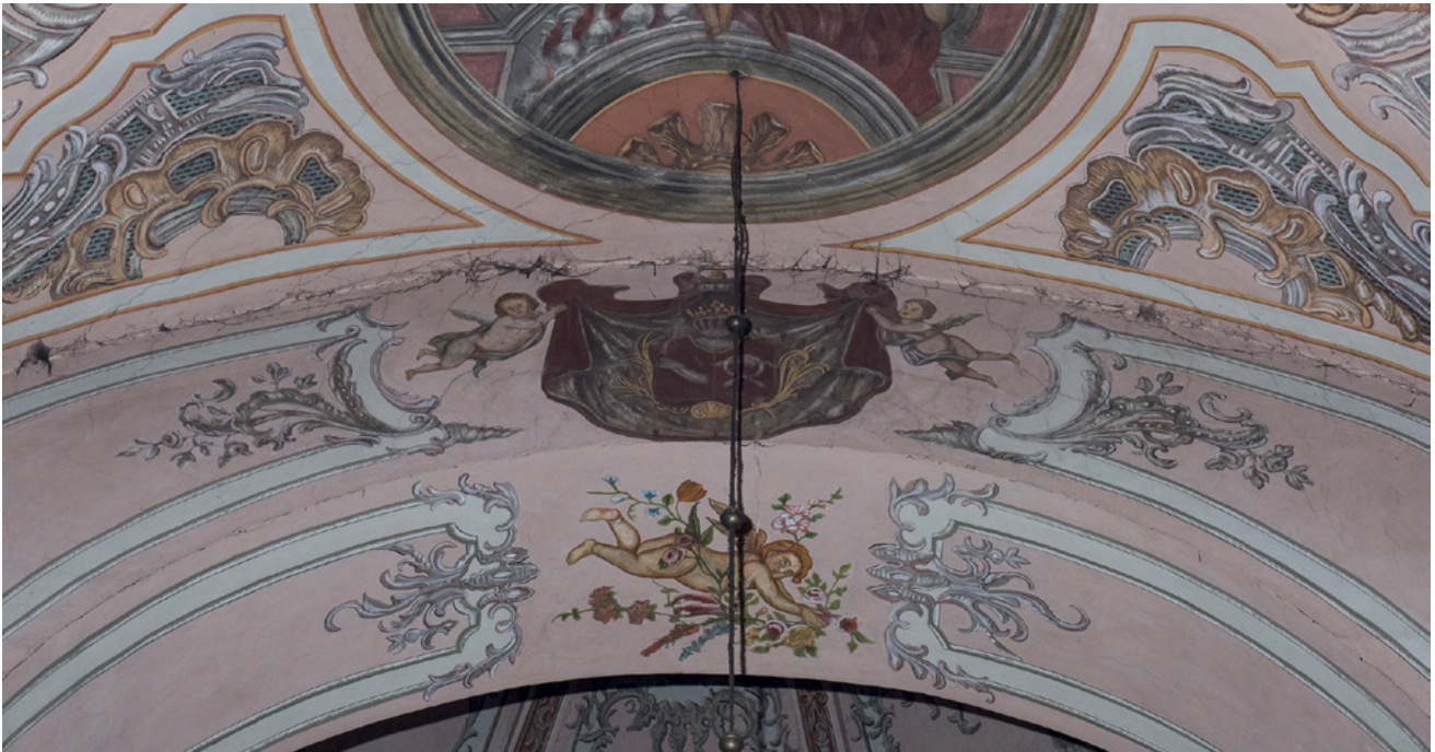
8 Fragment polichromii w kościele Bernardynów w Rzeszowie z herbami Szreniawa Lubomirskich i Junosza Małachowskich.