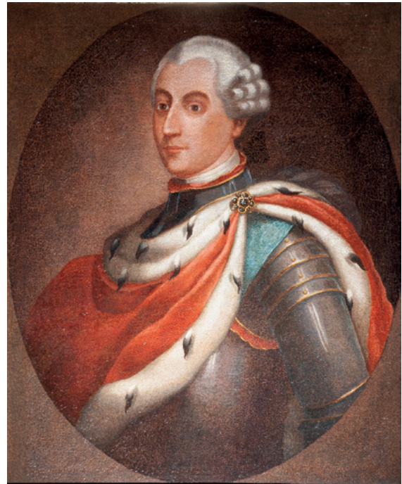
1 Portret Jerzego Ignacego Lubomirskiego (1687–1753), klasztor Bernardynów w Rzeszowie.

Kształtowanie stolicy dominium rzeszowskiego przez okazałe fundacje i inicjatywy artystyczno-budowlane było dziełem kilku pokoleń Lubomirskich, tj. Jerzego Sebastiana, Hieronima Augustyna i przede wszystkim Jerzego Ignacego (il. 1). To jego inicjatywy artystyczne wyróżniają się na tle działań ojca i dziada pod względem liczby i skali przedsięwzięć 10 . Wydaje się, że umiejętne łączenie nowych fundacji z kontynuacją wcześniejszych dokonań antenatów było związane z szerszym programem budowania wizerunku „państwa rzeszowskiego”. W ten sposób te artystyczne inicjatywy zyskiwały mocniejszy efekt propagandowy, a Lubomirscy mogli odwoływać się bezpośrednio do spuścizny Rzeszowskich, pierwszych właścicieli miasta, a szczególnie Ligęzów, dzięki którym ten ośrodek przeżywał okres rozwoju i prosperity gospodarczej. Istotne było podkreślanie związków z Ligęzami, które