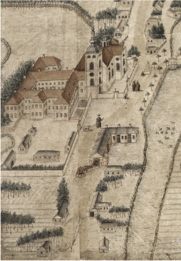
6 Założenie kościelno-klasztorne Bernardynów w Rzeszowie, fragment planu Rzeszowa Carla Heinricha Wiedemanna, 1762. Ze zbiorów Muzeum Okręgowego w Rzeszowie.

szczególną troskę i hojność cudownej figurze Matki Boskiej 43 .