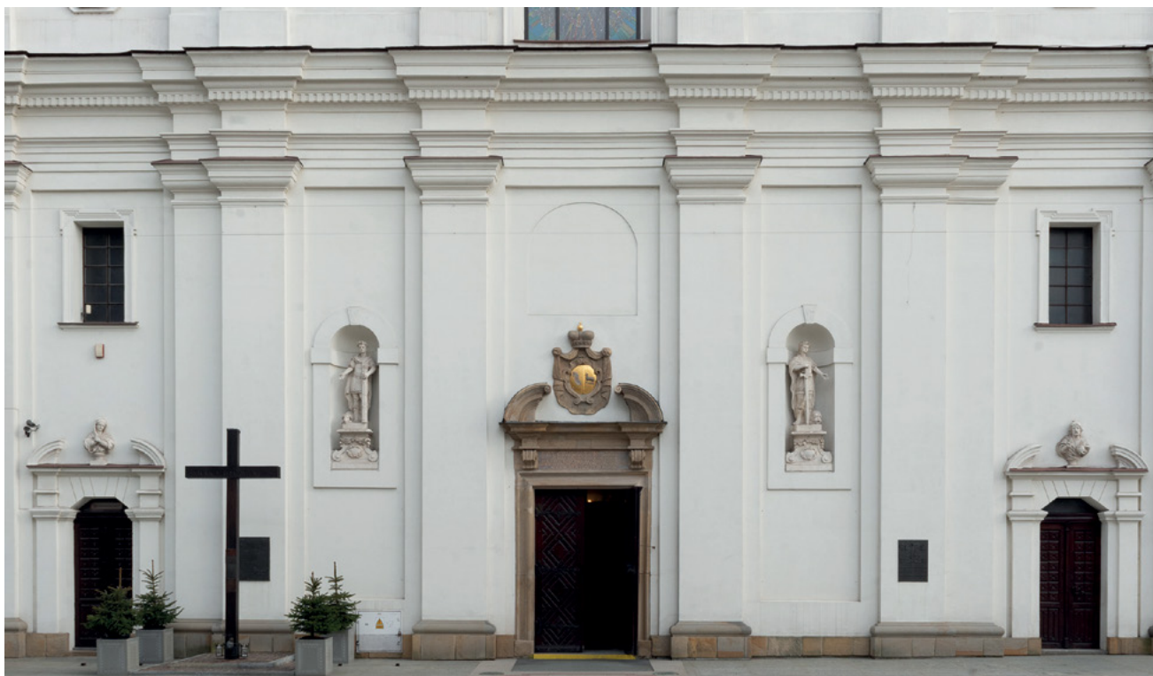
13 Portal główny kościoła Pijarów w Rzeszowie z inskrypcją i herbami Junosza oraz Szreniawa, ok. 1718–1730.

Obydwie budowle zostały stylistycznie ujednolicone, otrzymały trójosiowe pozorne ryzality zwieńczone trójkątnymi przyczółkami i symetrycznie rozstawione tak, aby zatrzeć nierówną szerokość ich fasad. Ponadto Tylman z Gameren zaprojektował dwie wieże ujmujące fasadę, nadające jej wygląd świątyni trójnawowej 64 . Tylmanowska przebudowa miała na celu zespolenie i kompozycyjne ujednolicenie całej budowli, by stała się ona dominantą architektoniczną głównej ulicy łączącej zamek ze Starym Miastem. W wyniku przebudowy rzeszowski zespół pijarski zyskał charakter monumentalnego założenia – kościoła w tzw. oprawie pałacowej, rozwiązania opartego na ówczesnych wzorach rzymskich 65 , które chętnie stosowano w innych placówkach zakonu, np. monumentalnym zespole w Szczuczynie ufundowanym przez podkanclerzego