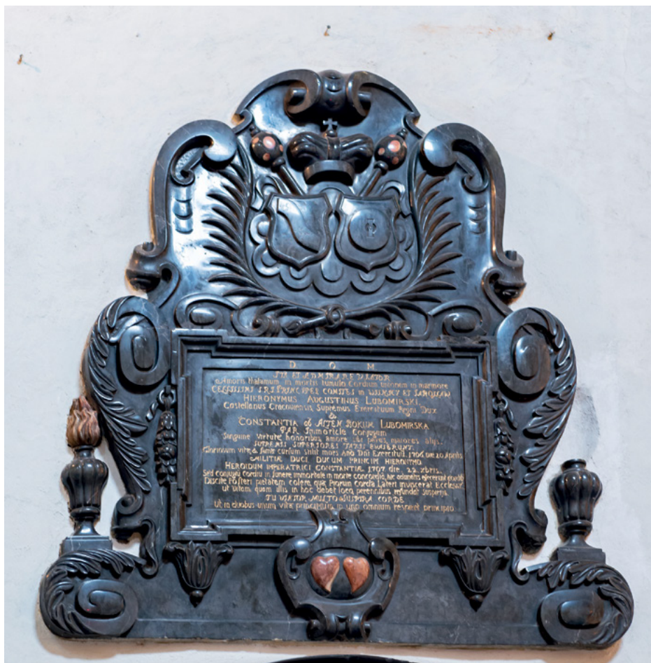
14 Nagrobek serc Hieronima Augustyna Lubomirskiego i Konstancji de Alten Bokum w prezbiterium kościoła Pijarów w Rzeszowie, po 1707.

serca – Jerzego Ignacego Lubomirskiego, ufundowane przez jego drugą żonę Joannę von Stein 72 . Epitafium z czarnego wapienia wykonane przez kamieniarzy dębnickich w latach 1755–1756 73 miało kształt stylizowanego asymetrycznego serca w rocaillowym obramieniu, zwieńczonego herbem Szreniawa z mitrą księżęcą i panegirykiem głoszącym chwałę księcia.