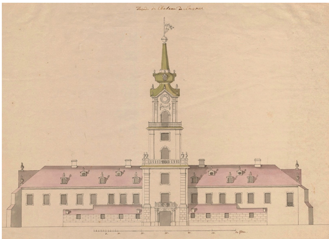
3 Projekt elewacji zachodniej zamku Lubomirskich w Rzeszowie, 1723, Muzeum Narodowe w Warszawie.