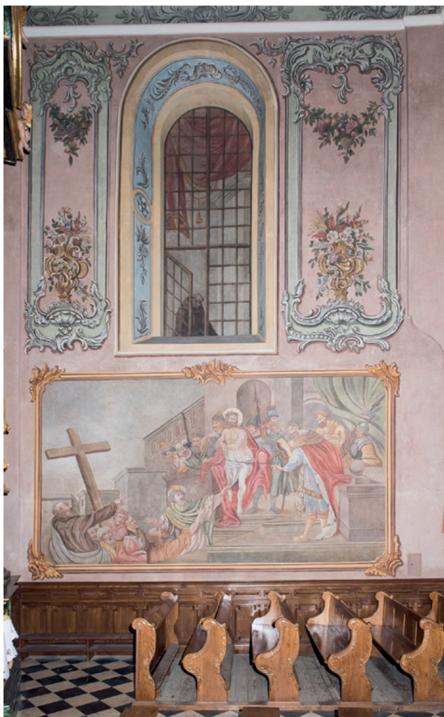
11 Wschodnia ściana kaplicy Chrystusa Ukrzyżowanego w kościele Bernardynów w Rzeszowie z widocznym zamurowanym oknem do oratorium Jerzego Ignacego Lubomirskiego.

przypomnieć, że pokoje fundatorskie w drewnianym klasztorze bernardyńskim zapewnił sobie w testamencie już Ligęza. Lubomirski jako dobrodziej konwentu kontynuował tę tradycję, czym podkreślał i wzmacniał swoją pozycję spadkobiercy Ligęzów, dysponującego własnym oratorium pełniącym równocześnie funkcję empery i łoży kolatorskiej 58 . Tego typu apartamenty we wnętrzach znamienitych klasztorów, mające swój rodowód w fundacjach królewskich i cesarskich, były również wykorzystywane przez magnatów 59 .