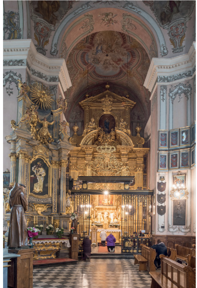
10 Kościół Bernardynów w Rzeszowie, kaplica Matki Boskiej.

przy powstaniu czterech pozostałych ołtarzy w nawie 53 i chóru muzycznego 54 , a być może również przegrody ołtarzowej, to możemy mówić o dążeniu Lubomirskich do kompleksowej aranżacji dekoracji i wyposażenia świątyni o wspólnym artystyczno-ideowym programie (il. 9, 10) 55 .