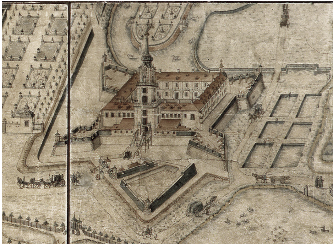
2 Zamek Lubomirskich w Rzeszowie, fragment planu Rzeszowa Carla Heinricha Wiedemanna, 1762. Ze zbiorów Muzeum Okręgowego w Rzeszowie.