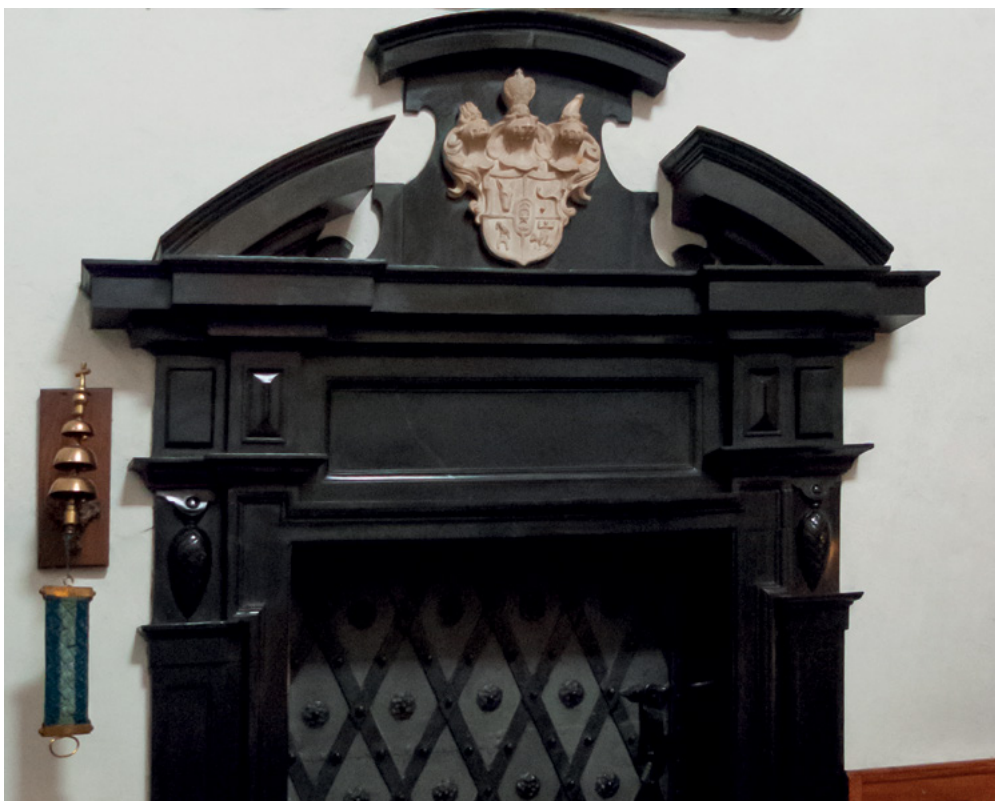
15 Fragment portalu w prezbiterium kościoła Pijarów w Rzeszowie z kartuszem herbowym.