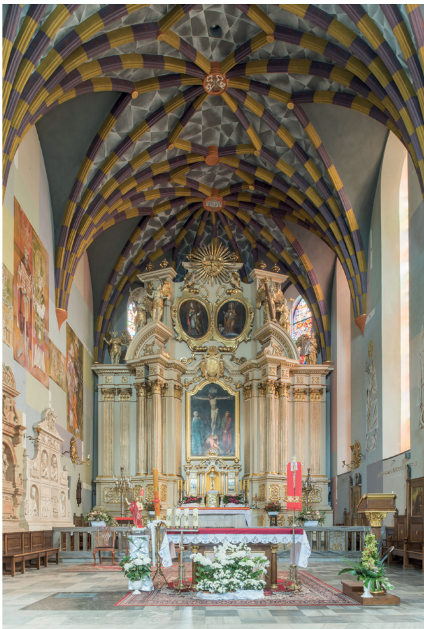
5 Wnętrze kościoła farnego w Rzeszowie z ołtarzami fundacji Jerzego Ignacego Lubomirskiego, ok. 1750. Fot. Piotr Jamski

przytęczowe, ołtarz w kaplicy bractwa Aniołów Stróżów (1753), prospekt organowy, a także obrazy ołtarzowe zamówione u Szymona Czechowicza i jego ucznia Jacentego Olesińskiego (il. 5) 37 .