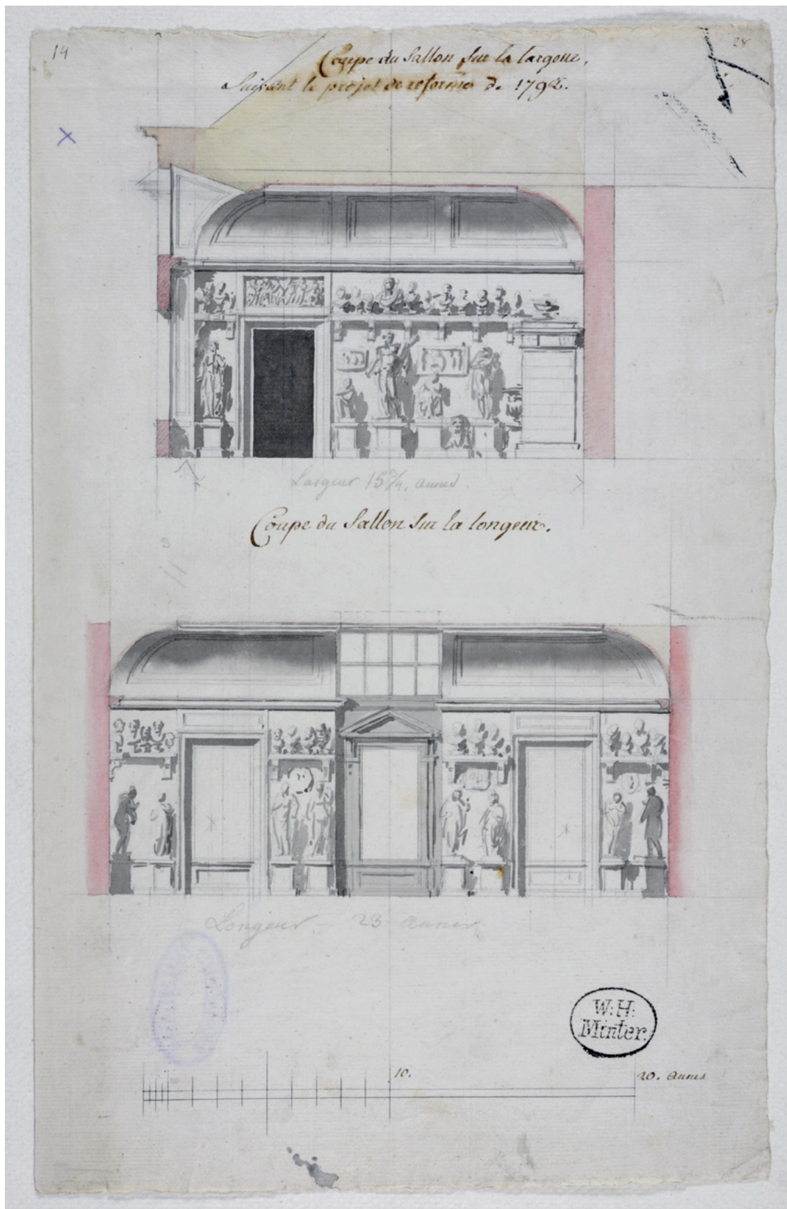
2 Johann Christian Kamsetzer, niezrealizowany projekt przebudowy pracowni rzeźbiarzy w Zamku Królewskim, 1792, Biblioteka Uniwersytecka w Warszawie, Gabinet Rycin, Inw. G.R. 2048.