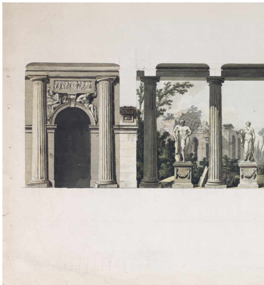
3 Johann Christian Kamsetzer, projekt galerii rzeźb antycznych w gmachu Oranżerii w Łazienkach, 1787–1788, Biblioteka Uniwersytecka w Warszawie, Gabinet Rycin, Inw. G.R. 240 (Zb. Jeż. 43).

świadczy przeznaczenie na jego ekspozycję obszernej sali w zamkowym atelier, która miała zostać wypełniona posągami i popiersiami ustawionymi na przyściennych konsolach. Projekt urządzenia tej sali, zamówiony w 1792 r. u Johanna Christiana Kamsetzera, ostatecznie nie został zrealizowany 29 (il. 2).