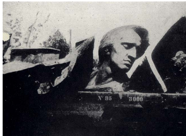
4 Fragmenty zniszczonego pomnika Chopina na platformie kolejowej, 1940. Repr. wg The Nazi Kultur in Poland , il. 14/2

Patrząc tylko z perspektywy losu dwóch wspomnianych pomników, zniszczonych w 1940 r., można uznać protokół za osobistą klęskę osób, które go sygnowały, za zbędny wysiłek, który nie był w stanie powstrzymać okupanta zapamiętałego w niszczycielskim dziele.