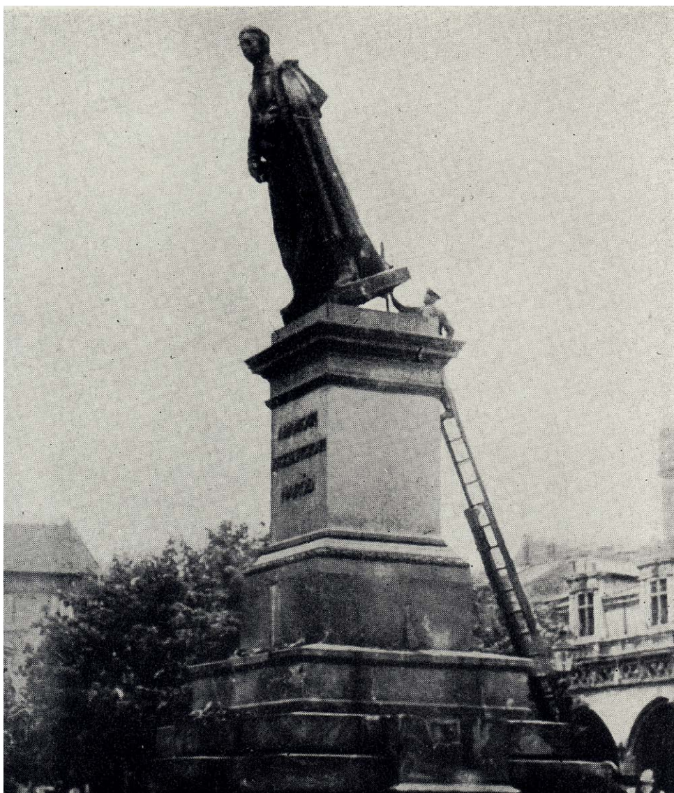
5 Zrzućenie figury Adama Mickiewicza z cokołu pomnika w Krakowie 17 sierpnia 1940. Repr. wg The Nazi Kultur in Poland , il. 15/2